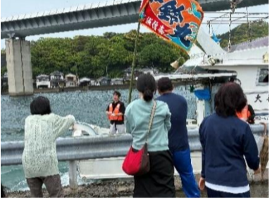
お兄さん！こっち投て〜！